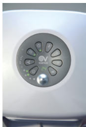
CONTROLO ELETRÓNICO E DISPLAY LCD