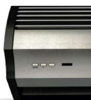
Comandos no aparelho